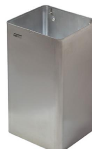
PP1065CS / PP1080CS acabado satinado