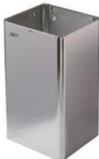
PP1065C / PP1080C acabado brillante