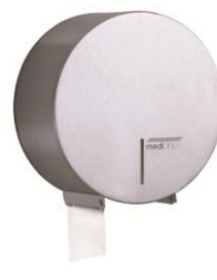
PR0787CS Acabado satinado