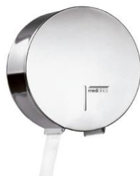
PR0787C Acabado brillante