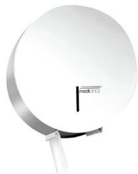
PR0787 Acabado epoxi blanco