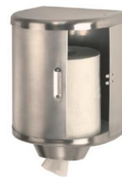
DT0303CS Acabado satinado