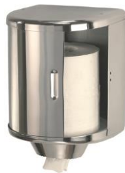
DT0303C Acabado brillante