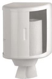
DT0303 Acabado epoxi blanco